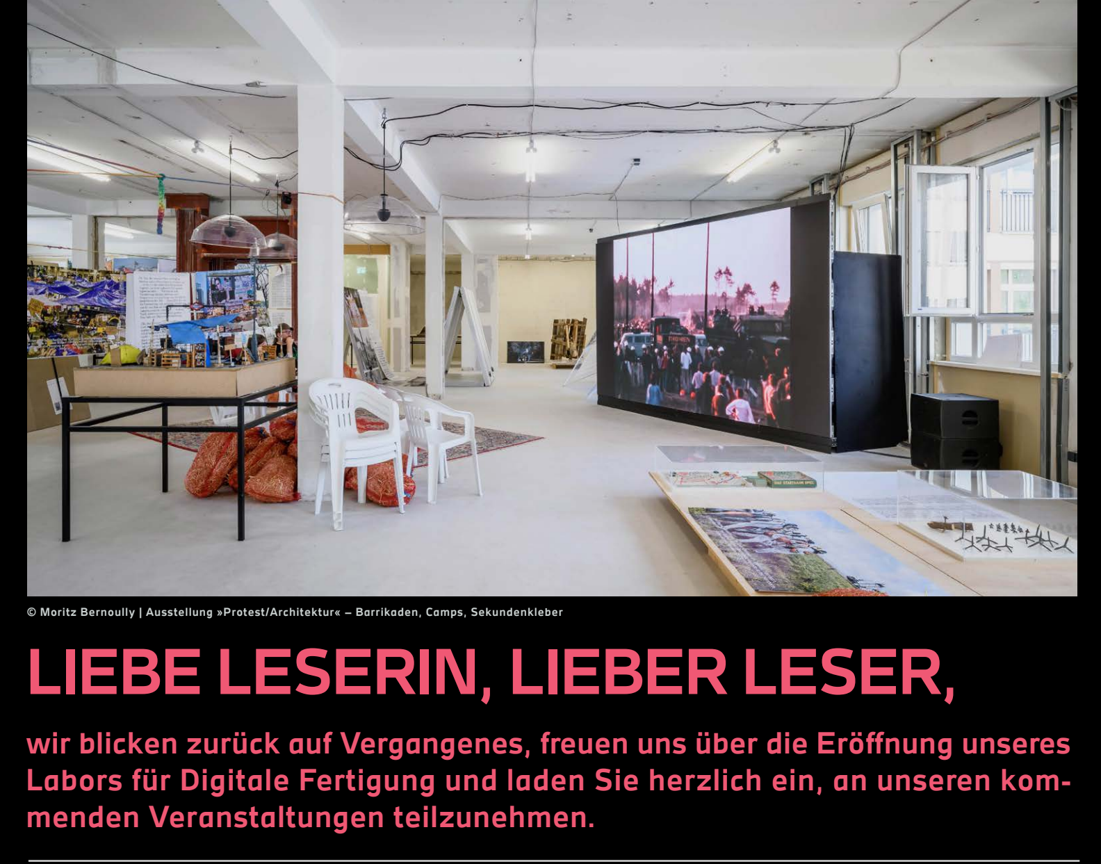
Ausstellung »Protest/Architektur – Barrikaden, Camps, Sekundenkleber

LIEBE LESERIN, LIEBER LESER, wir blicken zurück auf Vergangenes, freuen uns über die Eröffnung unseres Labors für Digitale Fertigung und laden Sie herzlich ein, an unseren kommenden Veranstaltungen teilzunehmen.