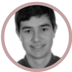
Marcel Master Photogrammetry & Geoinformatics

„Mein Learning: Einfach machen, auch wenn das Produkt noch nicht fertig ist. Wer sich für die erste Version seines Produkts nicht schämt, hat es zu spät auf den Markt gebracht.“